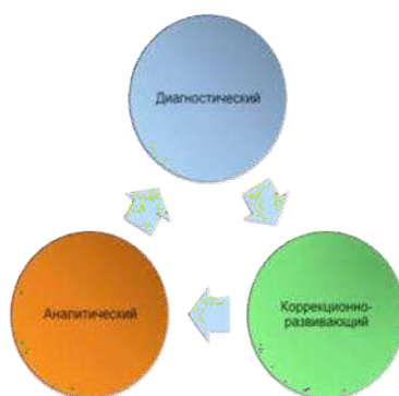
Схема 1. Модель этапов психолого-педагогического сопровождения. Диагностический этап. Методические рекомендации

На третьем этапе ( аналитическом ) проводится комплексный анализ результатов коррекционно-развивающей деятельности, в том числе повторная диагностика. По результатам анализа вносятся коррективы в индивидуальную программу психолого-педагогического сопровождения.